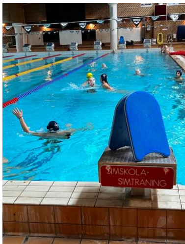
Vattenpolo ungdom träning